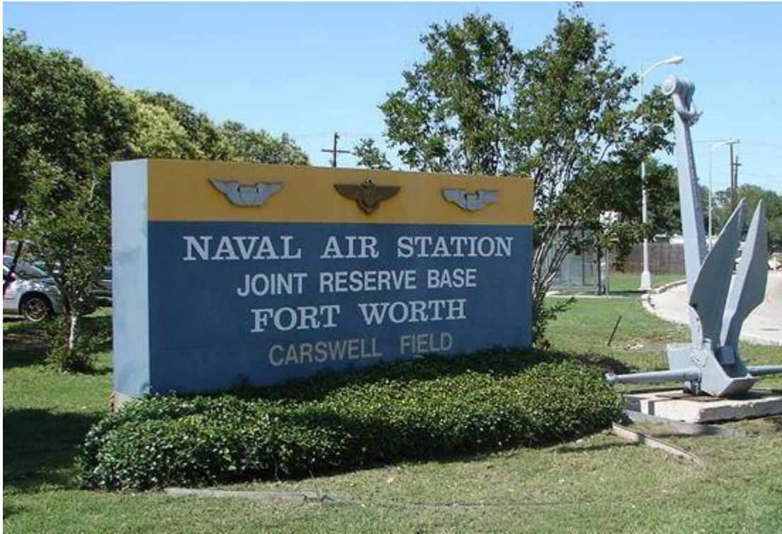
Base de la Fuerza Aérea Caswell ahora llamado Estación Aérea de Naval.

Debajo de la Base de la Fuerza Aérea Caswell, en un área secreta de la base hay un ascensor que te lleva hasta abajo. Mucha gente conoce el sistema de tranvías que pasa por debajo de Estados Unidos.